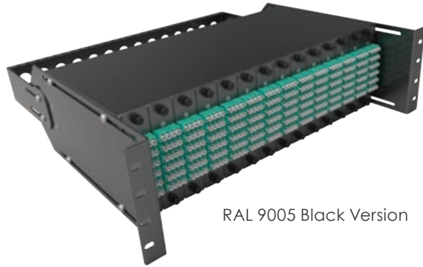
RAL 9005 Black Version