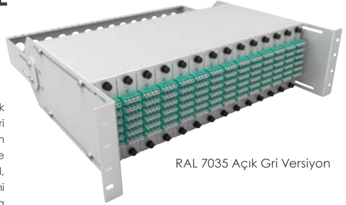
RAL 7035 Açık Gri Versiyon